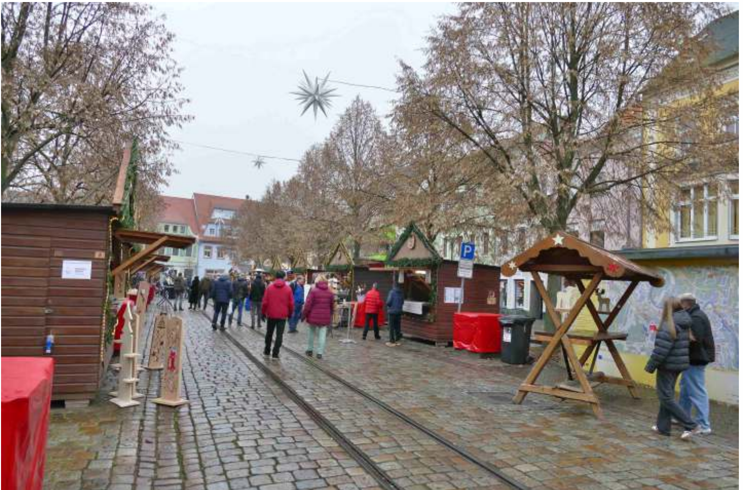
Der Weihnachtsmarkt auf dem Niedermarkt. Die erste Holzbudef rechts wurde von uns bedient.

Damit wollte man auch an den Erhalt der Strecke und ihre Reaktivierung für den Reisezugverkehr erinnern, die ja für 2030 geplant ist.