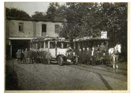
Der erste Kraftomnibus kommt im Sommer 1926 in Döbeln an

Der erste Kraftomnibus kam bereits im Sommer 1926. Es war ein Vomag (also aus Plauen im Vogtland) mit 30 Sitzplätzen und 10 Stehplätzen. Mit diesem Bus wurde am 19. August 1926 die Linie Döbeln (Obermarkt) - Roßwein eröffnet. Sie hatte vier Fahrten am Tag. Ein zweiter Omnibus kam im Oktober, ein dritter im Dezember. Nun fuhren Omnibusse auch im Stadtverkehr, und der Betrieb der Pferdestraßenbahn endete am 20. Dezember 1926. Als Firmenname gab es die Döbelner Straßenbahn noch bis 1954.