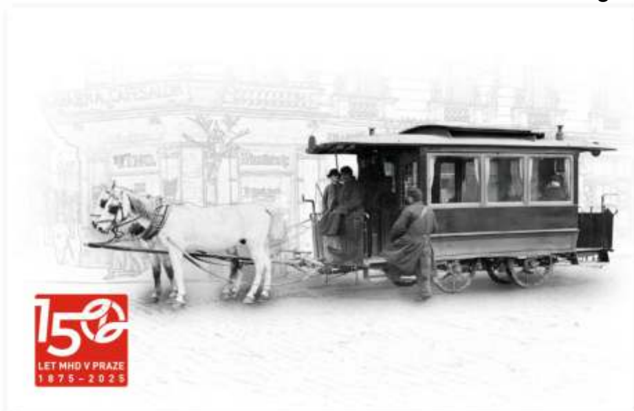
Vorderseite des Markenheftchens

Im vorigen Jahr konnte in Prag das Jubiläum 150 Jahre öffentlicher Personennahverkehr gefeiert werden. Neben verschiedenen anderen Souvenirs erschien aus diesem Anlass auch ein Briefmarkenheftchen.