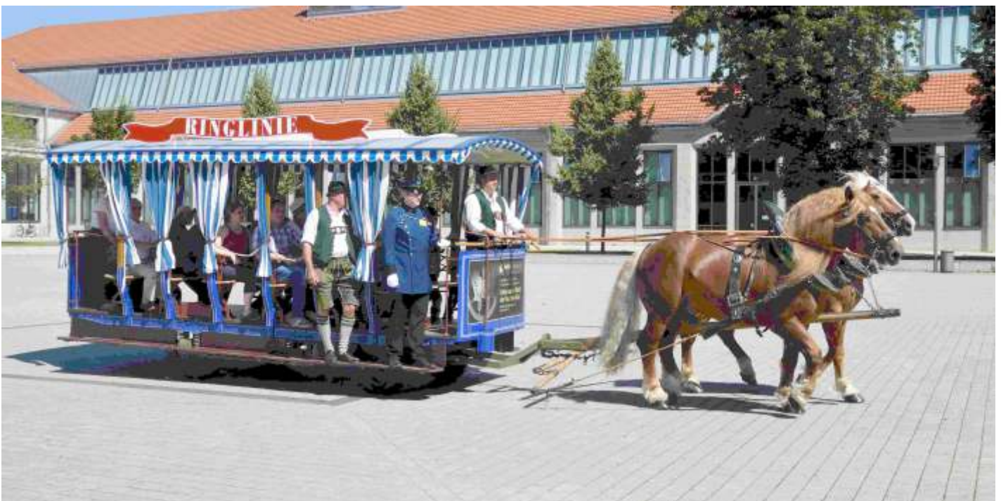
Der Münchener Pferdebahnwagen bei einer Fahrt auf gummibereiften Rädern